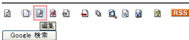
図 1: 編集画面の「ページを更新」

編集画面の「ページを更新」ボタンの隣にある、「タイムスタンプを変更しない」にチェックをいれてください。